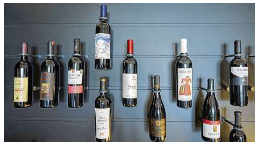
Eine Installation mit rund 100 Weinflaschen aus der ganzen Welt versammelt im Vineum alle Weinanbaugebiete rund um den Globus.

Weitere Informationen unter: www.vineum-bodensee.de