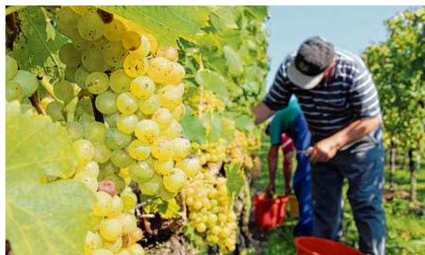
Auf die Weinlese kommt es an: Nur einwandfreies Lesegut garantiert Spitzenweine. Darauf legen alle etablierten Winzerbetriebe am Bodensee größten Wert.

Das Staatsweingut Meersburg, das einst im Besitz der Fürstbischöfe von Konstanz war, betreibt seit 1210 urkundlich belegten Weinbau. Heute gehört das Weingut dem Land Baden-Württemberg. Es bewirtschaftet rund 60 Hektar Rebfläche. Dazu gehören auch der Olgaberg am Hohentwiel,