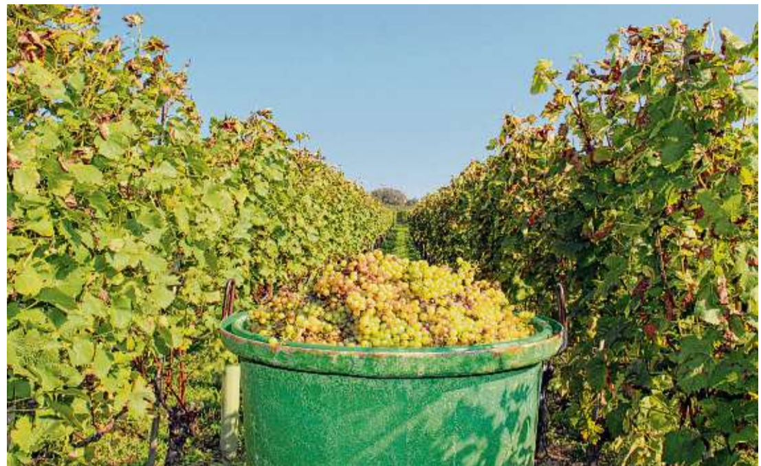
Der Müller-Thurgau ist eine der wichtigsten Rebsorten am Bodensee. Im Vineum Bodensee sind in den auf zwei Etagen verteilten Räumen unterschiedlicher Größe Aufschlussreiches und Kurioses, Interaktives und Geschichtliches zum Thema Meersburg, Wein und Kultur zu sehen.

Letzteres wird sicherlich ein besonderes Schmankerl im Kulturprogramm der Stadt Meersburg wer-